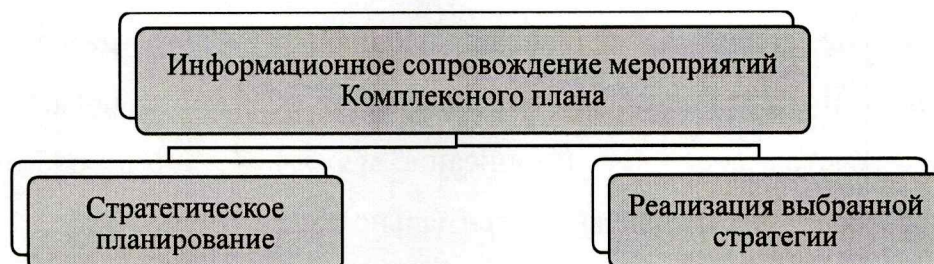
Рисунок 2 – Планирование информационного сопровождения мероприятий Комплексного плана

Основные принципы информационного сопровождения мероприятий Комплексного плана основываются на базовых принципах: